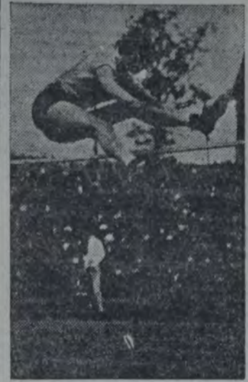
LA SEÑORITA CATHERWOOD, campeón olímpica de salto en alto, que evidenció su espíritu "amateurista" al aceptar un premio de 3.000 dólares y un automóvil, por sus hazañas deportivas en Amsterdam.

Es sabido que la primera Marathon del mundo fué aquella carrera del soldado griego que recorrió sin descanso la distancia que separaba las Lanuras de Marathon de Atenas, para dar la