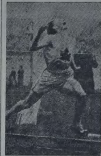
WILLIAMS, CAMPEON DEL mundo de los 100 metros, canadiense y compatriota de Catherwood, que también aceptó un auto y 1.500 dólares por sus triunfos en la última olimpiada. Ambos siguen siendo considerados oficialmente como "aficionados".

Motivó la reanudación de las discusiones, la noticia de que los atletas canadienses Williams y Cather-