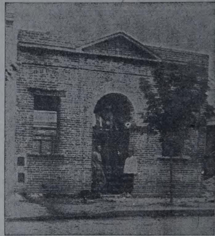
ESTADO DE LAS OBRAS DE LA CASA DEL PUEBLO, DE LANÚS

lo que ha permitido realizarla en mejores y más económicas condiciones, además de contarse, como se ha contado, con la generosa contribución de varios afiliados y simpatizantes en cuanto se refiere a la prestación de sumas de dinero, cesión de materiales sanitarios, carpintería, herrería de