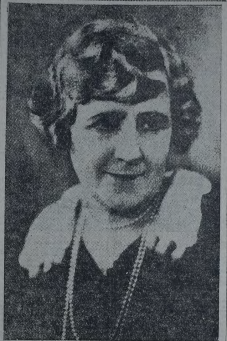
LA CONOCIDISIMA ACTRIZ ROSARIO PINO, A QUIEN, EN MERITO a su larga y brillante carrera artística, acaba de otorgárselo — en compañía con Leocadia Alba — el premio "María Guerrero".