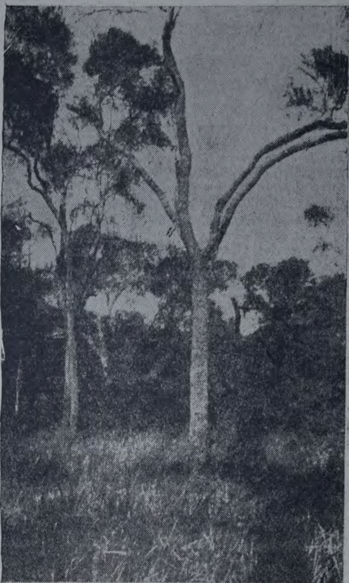
DOS CARACTERÍSTICOS EJEMPLARES DE QUEBRACHO DE LAS selvas chaqueñas.

El quebracho santafesino, primo hermano del santiagueño, se distingue fácilmente por sus hojas enteras. Es árbol menos corpulento, presentando sin embargo su madera casi las mismas características, pero su propiedad particular es su gran riqueza en tanino. El tanino es una substancia muy común en el reino vegetal: es ella la que da su sabor astringente a muchas plantas, especialmente a